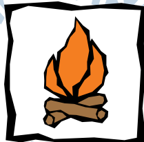
Schneeschmelz- und Kältevertreibungsanlage

Hast du „trotzdem“ Lust auf das WINTERCAMP ?