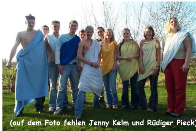
(auf dem Foto fehlen Jenny Kelm und Rüdiger Pieck)